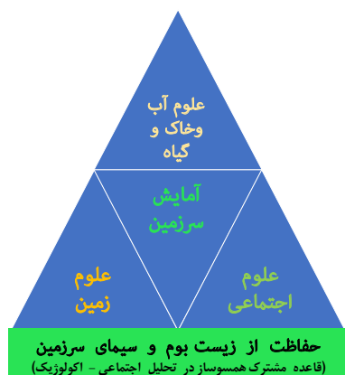
شکل ۱- طرح‌واره کلی ارتباطات علمی با محوریت آمایش سرزمین

زیستی-فنی خود را بیابد. شکل (۱) طرح‌واره‌ای کلی از ارتباطات علمی با محوریت آمایش سرزمین را نشان می‌دهد.