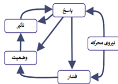
شکل ۲- چارچوب DPSIR برای توسعه مدل مفهومی در جهت ارزیابی پایداری منابع آب زیرزمینی

۵- ارتباط بین ذی‌نفعان: در چارچوب پروژه ارزیابی پایداری، ذی‌نفعان به عنوان افراد و سازمان‌هایی تعریف می‌شوند که ممکن است تحت تأثیر پروژه قرار گیرند یا اینکه می‌توانند بر اجرای آن تأثیر بگذارند. این گروه شامل افرادی است که در منطقه، مطالعه و زندگی می‌کنند، از جمله اعضای تیم پروژه برنامه‌ریزان، تصمیم‌گیرندگان و مردم هستند. در کل مشارکت ذی‌نفعان باید بخشی از تمام اجزای پروژه ارزیابی پایداری آب زیرزمینی باشد.