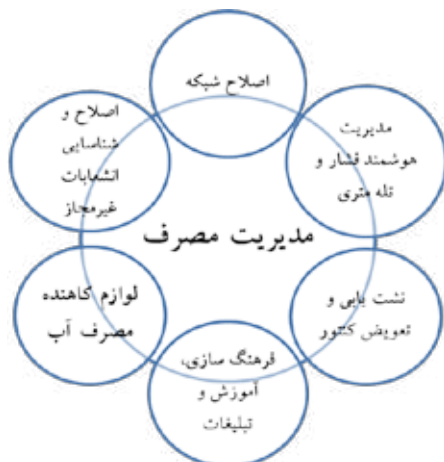
شکل ۳- راهکارهای مدیریت مصرف در شبکه‌های توزیع آب شهری