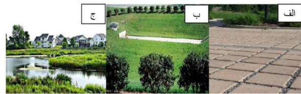
تکنیک‌های مدیریت رواناب برای خیابان‌ها و کوچه‌ها: الف) پیاده‌رو متخلخل ب) حوضچه نگهداشت خشک ج) حوضچه نگهداشت مرطوب

۳) بهترین تکنیک‌های مدیریت رواناب برای خیابان‌ها و کوچه‌ها: این دسته از تکنیک‌ها، روش‌هایی هستند که سعی بر به حداقل رساندن سطوح نفوذناپذیر و کنترل میزان رواناب، آلودگی و کنترل رسوب در معابر شهری و سطح شهر هستند. از این دسته می‌توان به پیاده‌روها و سنگ‌فرش‌های متخلخل، حوضچه‌های نگهداشت خشک، حوضچه‌های مرطوب، حوضچه‌های فیلتر شنی و سیستم‌مانند بیولوژیکی اشاره کرد.