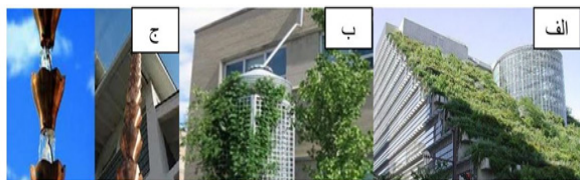
شکل ۴- بهترین تکنیک‌های مدیریت رواناب برای ساختمان‌ها: الف) بام سبز ب) مخزن ذخیره آب باران ج) زنجیره باران

۲) بهترین تکنیک‌های مدیریت رواناب برای ساختمان‌ها: این دسته از تکنیک‌ها، روش‌هایی هستند که در ساختمان‌ها، مناطق مسکونی و تجاری بیشترین کاربرد را دارند. از این دسته می‌توان به بام‌های سبز، آب‌انبارها و مخازن ذخیره باران و زنجیره‌های باران اشاره کرد.