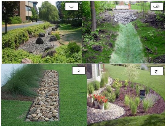
شکل ۳- بهترین تکنیک‌های مدیریت رواناب برای مناظر فضای سبز: الف) آبراهه با پوشش گیاهی ب) آبراهه زیستی ج) باغچه ذخیره باران د) ترانشه نفوذپذیر

۲) بهترین تکنیک‌های مدیریت رواناب برای ساختمان‌ها: این دسته از تکنیک‌ها، روش‌هایی هستند که در ساختمان‌ها، مناطق مسکونی و تجاری بیشترین کاربرد را دارند. از این دسته می‌توان به بام‌های سبز، آب‌انبارها و مخازن ذخیره باران و زنجیره‌های باران اشاره کرد.