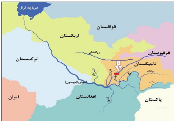
شکل ۲- موقعیت کشورهای آسیای مرکزی نسبت به رودهای آمودریا و سیردریا

است. همان گونه که بارش در حوضه دریای آرال بسیار کم است، این روانابها به صورت کلی از ذوب برف و یخچالهای طبیعی کوهستانی کشورهای بالادست تولید می شود (امیراحمدیان و ناصری، ۱۳۹۲).