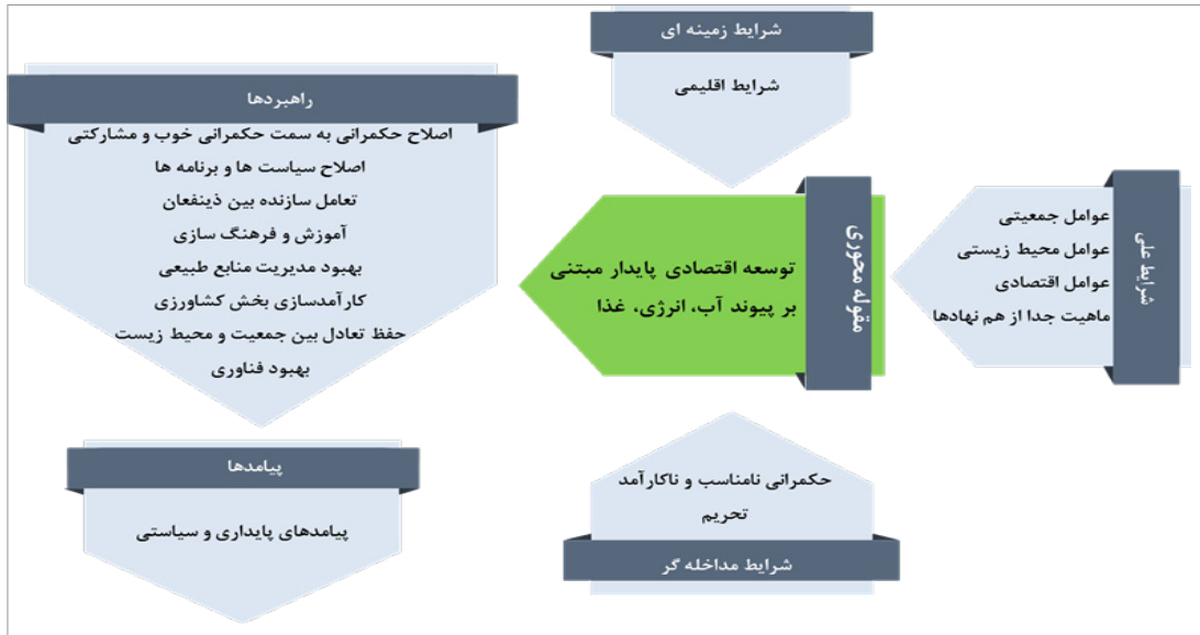
شکل ۱- مدل یکپارچه زیست محیطی توسعه اقتصادی پایدار آب، انرژی، غذا