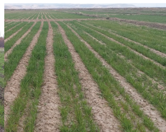
شکل ۴- کاشت گندم به وسیله ماشین کف کار (تصویر راست) و روش کاشت مرسوم در داخل کرت (تصویر چپ)

میزان آب آبیاری مزرعه تیمار کشت مکانیزه در هر نوبت براساس تعیین نیاز آبی گیاه محاسبه و اعمال شد و آبیاری ادامه می‌یافت تا زمانی که آب به انتهای مزرعه برسد. برای محاسبه نیاز آبی از نرم‌افزار