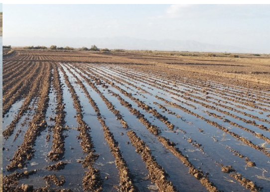
شکل ۳- روش آبیاری شیاری (تصویر راست) و آبیاری کرتی (تصویر چپ)