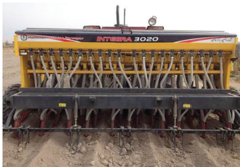
شکل ۲- خطی کار کف کار ۲۰ ردیفه برای کاشت در داخل شیار آبیاری

کارنده مورد استفاده در تیمار کشت مکانیزه، ماشین کاشی اراضی شور (کف کار) مدل INTEGRA ۳۰۲۰ ساخت شرکت ماشین برزگر همدان بود (شکل ۲). این نوع خطی کار در فرآیند انتقال بذر و کود از مخزن به بستر بذر ساختاری مشابه سایر بذرکارهای متداول دارد ولی با الحاق تعداد ۵ جوی و پشته ساز ۲ مخصوص باعث ایجاد جویچه‌هایی با عرض (فاصله مرکز به مرکز پشته) ۶۰ سانتی‌متر شده و بذر و کود را به صورت حجمی روی چهار ردیف به فواصل ۱۰ سانتی‌متر در داخل جویچه‌ها کشت می‌نماید.