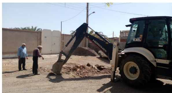
شکل ۲- تلاش بی ثمر برای یافتن دهانه مسدود شده یک میله‌چاه قنات در جوار بلوار سردار محمدآبادی شهر بم، اردیبهشت ۱۴۰۰

"چند سال پیش، شهرداری بم نیاز به اطلاع از عمق یک میله چاه درحوالی بلوار شهیدمحمدآبادی داشت. اما پس از چند ساعت تلاش کارگران و همچنین استفاده از بیل مکانیکی، و باوجود راهنمایی‌های نماینده قنات، موفق به یافتن محل دقیق میله چاه مورد نظر نشدند. در آخر به دلیل احتمال آسیب‌رسانی به انشعابات آب و گاز عبوری از محل، فعالیت‌های یافتن دهانه میله چاه مورد نظر متوقف شد. همچنین از آنجایی که دهانه سایر میله چاه‌های قبلی و بعدی نیز مسدود بوده، امکان ورود به کانال قنات از زیر نیز به راحتی میسر نبوده است (تصویر مربوطه در شکل (۲) قابل مشاهده است)." (مصاحبه شماره ۱۴)