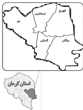
شکل ۱- موقعیت شهرستان‌های شرقی استان کرمان

کرمان در حاشیه جنوبی بیابان لوت است. براساس آمار سال ۱۳۹۰ اداره منابع آب شهرستان بم، تعداد قنات احصا شده (اعم از فعال و غیرفعال) در این شهرستانها بالغ بر ۳۹۵ مورد بوده است (اداره منابع آب شهرستان بم، ۱۳۹۰). رشته کوه‌های هزار و جبالبارز، حوزه آبریز دهبکری و رودخانه نسا منابع اصلی تغذیه آب‌های زیرزمینی این منطقه هستند و شیب موافق زمین نیز شرایط حفر و آبدهی قنات‌های پرتعداد این منطقه را فراهم نموده است.