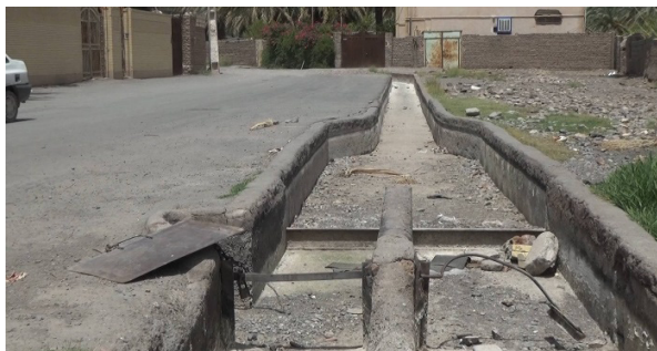
شکل ۳- خشک شدن قنات پرآب قنبرآباد شیخی شهرستان بم به علت انسداد یکی از میله‌چاه‌ها در اثر عملیات عمرانی- اردیبهشت ۱۴۰۱

حریم قنات در منطقه شرق استان کرمان، در قالب ۳ نوع نقض حریم ضرری، هوایی و کیفی قنات و ۱۰ محور زیر آن‌ها، شناسایی و دسته‌بندی شدند. این مقوله‌بندی در شکل (۴) ارائه شده است.